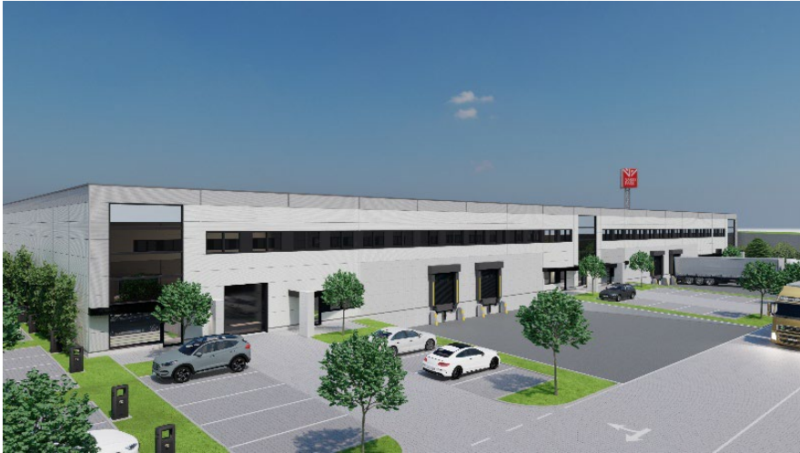
Geplanter VarioPark L in Reiskirchen, Siemensstraße 9-11 (Renderings: M&P Architekten)