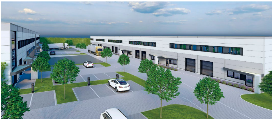
Geplanter VarioPark in Reiskirchen, Siemensstraße 9-11 (Gewerbegebiet „Im Kesselstück“), Gesamtansicht VarioPark L (links) und VarioPark (rechts)