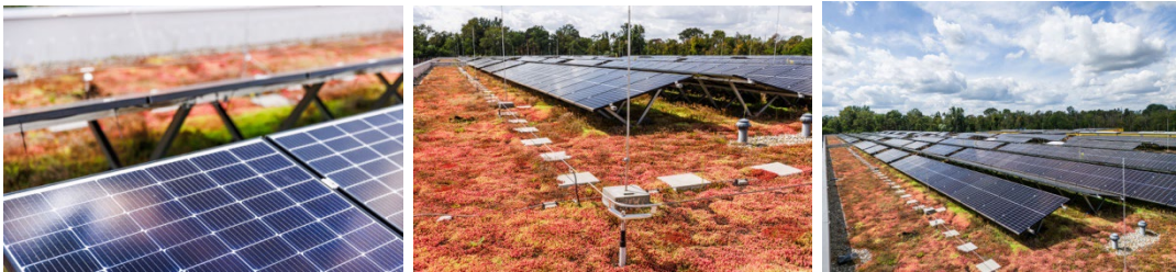
Photovoltaikanlage und Dachbegrünung als Teil des Nachhaltigkeitskonzeptes (Fotos aus anderen VarioParks mit identischem Konzept)