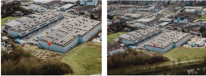
Vogelperspektive auf den VarioPark Reiskirchen